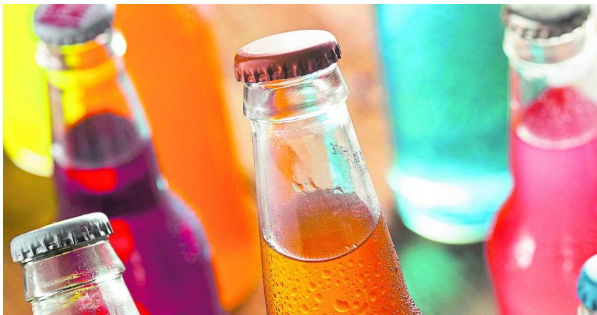
En México, Chile, Francia, Hungría, el Reino Unido, Portugal e India, entre otros países, ya se aplica este impuesto.