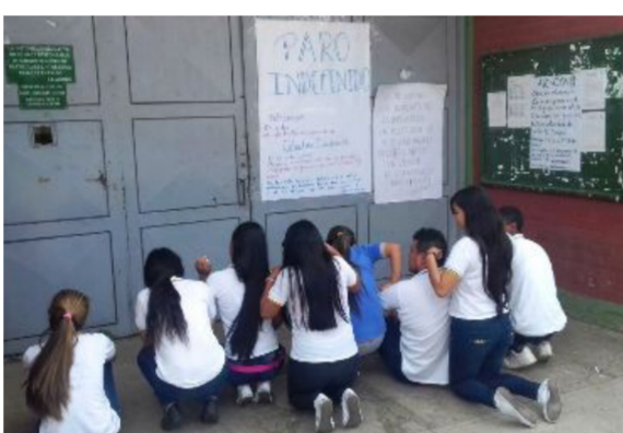
Abrieron investigación a 20 colegios en Cali por pedir bonos de altos costos